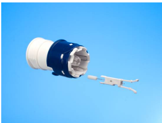
Abb. 5: Multiclix-Trommel und Lanzette