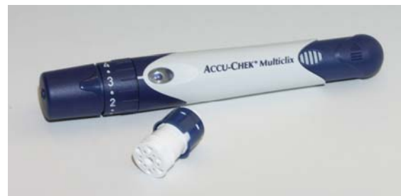
Abb. 6: Multiclix