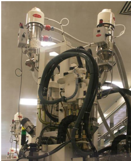
Abb. 4: Vertikale Spritzeinheiten der Maschine für 2-Komponentenspritzguss